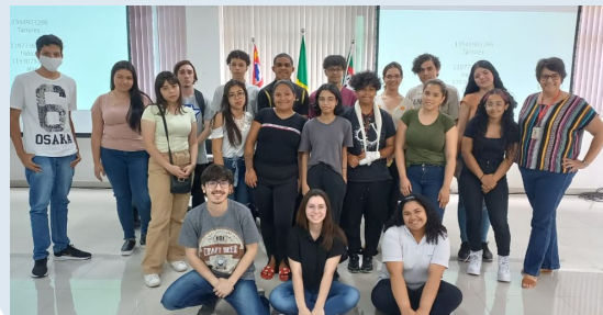
Atividade seletiva Parceria Fundação Siemens - UGADS

Promover, através da inclusão produtiva, a autonomia e o protagonismo das pessoas e famílias atendidas pela rede socioassistencial do SUAS Jundiaí, visando fortalecer as potencialidades, contribuindo para a redução da desigualdade social por elas vivenciadas.